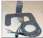
Kit para módulo remoto

La báscula EQM cuenta con ruedas que le permiten llevar la báscula a donde lo requiera, opera con batería recargable de hasta 100 horas de uso continuo.