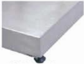
Plato en Acero Inoxidable