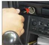
Adaptador para automóvil

Las básculas EQM están diseñadas para soportar el ritmo de trabajo de los comercios y la industria. Cuenta con un tope central de sobre carga que previene daños en la celda de carga, se complementa con los 4 toques de esquina, los cuales protegen la báscula contra impactos.